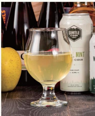
BRAUERTAFEL ブラウアターフェル