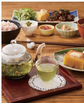
Tsumugi (ツムギ) 和カフェ Tsumugi

※なくなり次第終了。他のクーポンとの併用はできません。※展開商品は予告なく変更になる場合がございます(告知は店頭にて行います)。