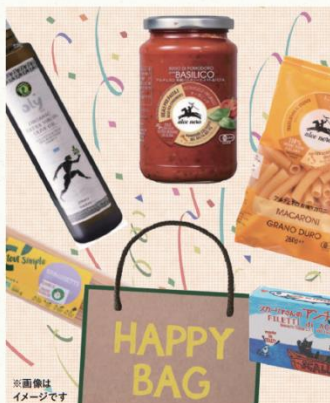
Bio c' Bon (ビオセボン)

*1: 6月17日(水)~7月19日(日)まで、他のWEB媒体とのクーポン併用不可、お一人様一点まで。並売き料理ご注文のお客様に限ります。各日先着30名様まで。 *2: 6月17日(水)~12月31日(木)まで、お一人様2点以上のご購入時、店内でのご飲食時にハードサイダーをご注文頂いたお客様に限ります。1週間以内の店内ご飲食時のレシートをご持参ください。