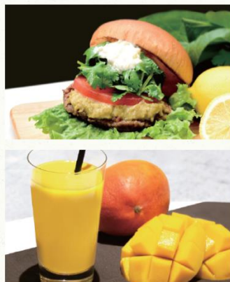
the 3rd Burger