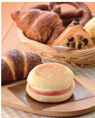
NATURAL LAWSON ナチュラルローソン クォール

6月17日(水)~7月19日(日)の期間中、ナチュラルローソンインスタペーカリーの対象商品が週替わりで50円引。