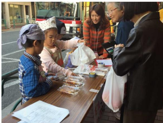
▲ウィロード山王商店街で開催した際の写真

協力ショップ：1F 口福堂、1F シェ、リュイ、1F 不二家、1F タリーズコーヒー、2F スターバックスコーヒー