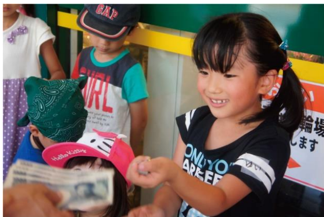
▲ウィロード山王商店街で開催した際の写真

そんな開発者の想いに共感したことがきっかけで、今回初めてアトレ大森で開催することとなりました。本企画の実施を通し、愛着をもってもらい、未来のファンにつなげていきたいと思っています。また、今後も地元企業との連携を図り、地域の方から愛されるコンテンツを発信していきたいと考えております。