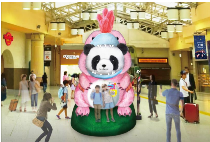
デイノケイルス巨大着ぐるみパンダイメージ