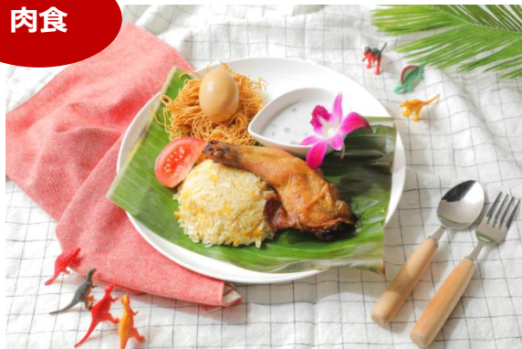
マンガツリーカフェ