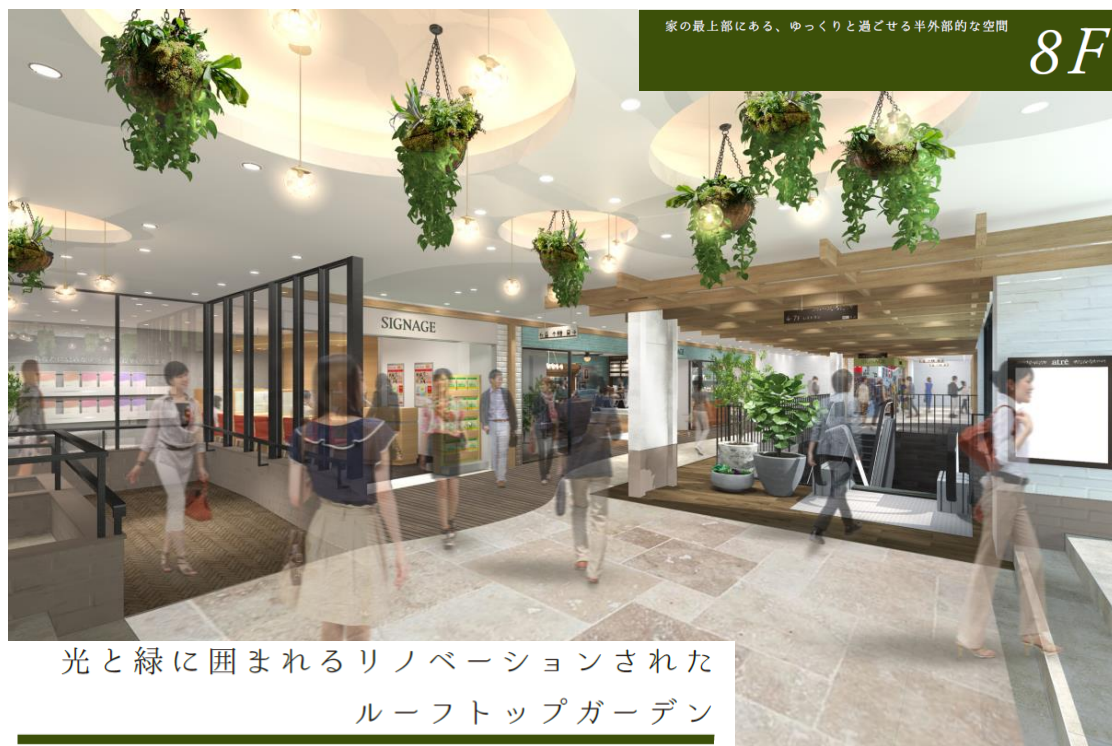
光と緑に囲まれるリノベーションされた ルーフトップガーデン