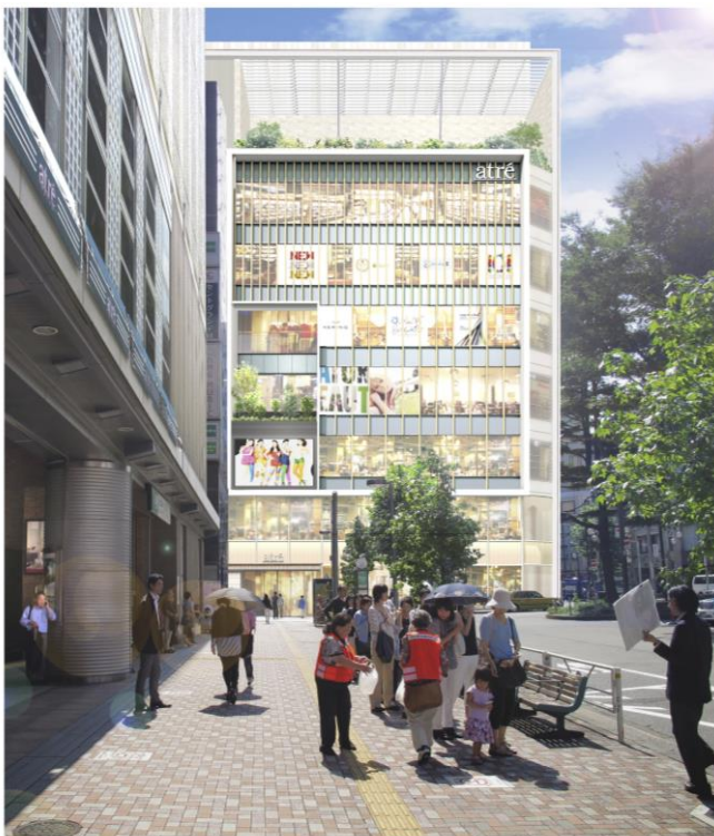
外観イメージ (JR 恵比寿駅 西口ロータリー側)