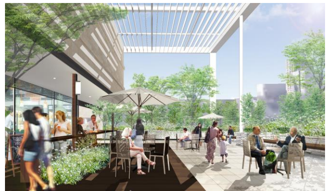
8階 屋上ガーデンテラスイメージ