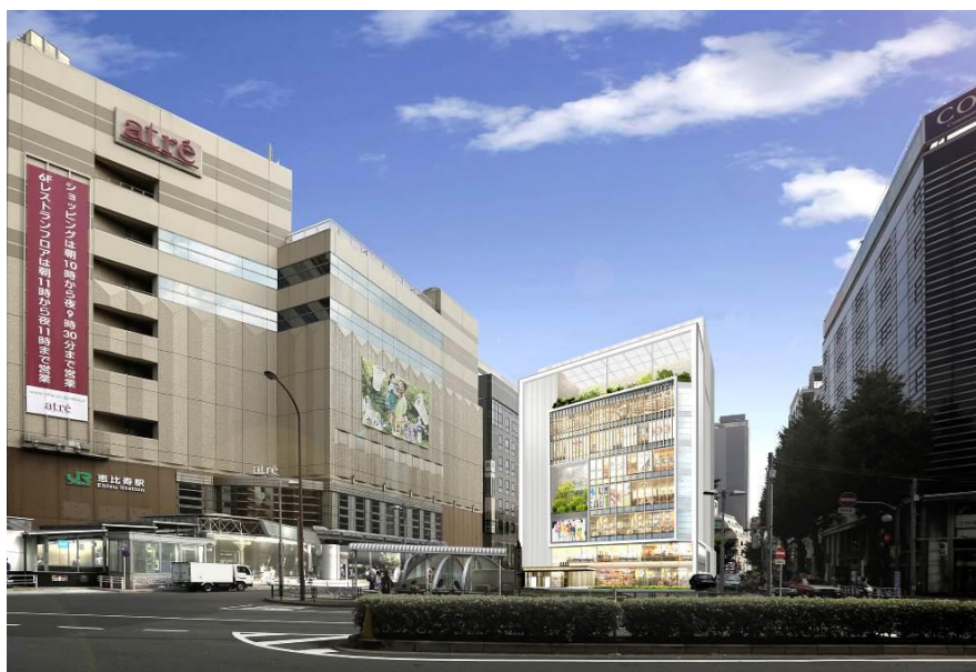
<アトレ恵比寿全体イメージ(正面が西館外観イメージ)>

『La Patio(中庭) ～“わたし”と“街”とをつなぐ場所～』をコンセプトに、恵比寿での生活をより豊かに、より楽しみたい、恵比寿居住の皆様が日常的に立ち寄れる場所を創出していきます。