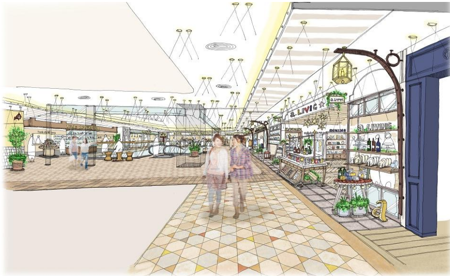
〈5階イーストサイドイメージ〉