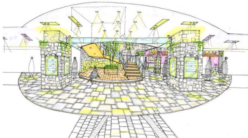
<B1F 改装区画周辺イメージ>