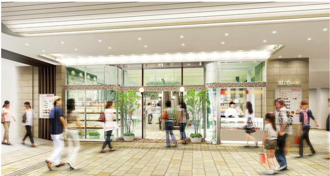
<エントランス イメージ>

毎日をもっと、心地よく、満たされたものにしたいから あなたの街で、いつもあなたのために ちょっといいが、ちゃんとある