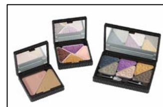
1階 マリークウント

日々の生活の「美」や「健康」に注目し、1階に新しくコスメからファッションアイテムまでトータルコーディネート提案する NEW ショップ「マリークウント」が、2階にはドラッグストアの「ハックドラッグ」(拡大)がオープンし、地域の皆さまの生活により身近で、より便利な存在になります。