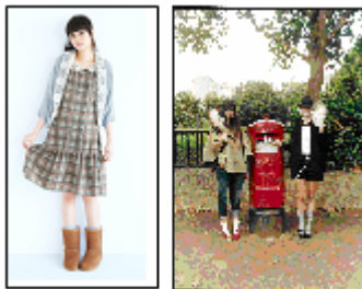
2階 アース ミュージック&エコロジー プレミアムストア