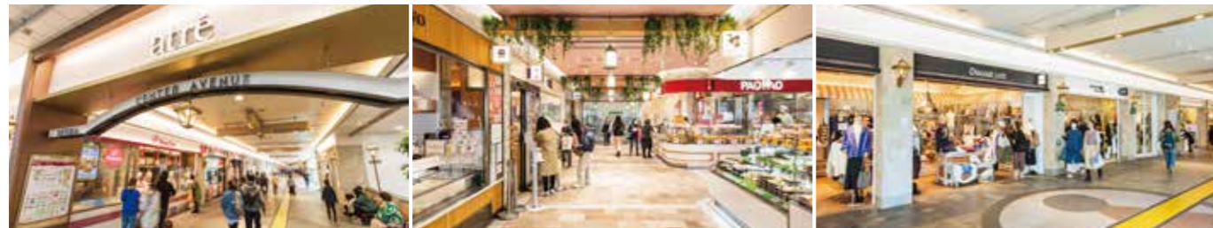
開業：2006年2月2日 アトレ化：2016年12月5日 SC階数：駅構内 SC延床面積：2,312㎡ 店舗面積：1,599㎡