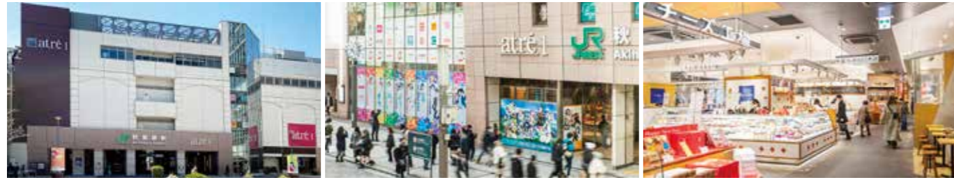
【アトレ秋葉原1】 開業：2010年11月19日 SC階数：地上6階 SC延床面積：9,403㎡ 店舗面積：2,929㎡ 【アトレ秋葉原2】 開業：2005年6月2日 SC階数：地上6階 SC延床面積：2,150㎡ 店舗面積：1,452㎡