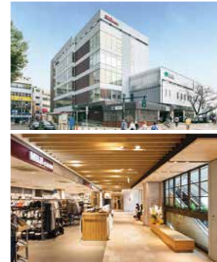
開業：2010年3月25日 SC階数：地上5階 SC延床面積：2,898㎡ 店舗面積：1,605㎡