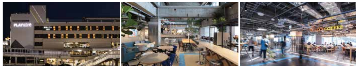
開業：1983年4月2日 アトレ化：2018年3月29日 SC階数：地下1階、地上6階 SC延床面積：16,381㎡ 店舗面積：7,363㎡