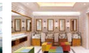
使い心地のいいトイレ