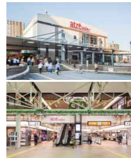
【エキソト】 開業：1999年10月29日 アトレ化：2010年4月1日 SC階数：地上5階 SC延床面積：2,745㎡ 店舗面積：1,584㎡ 【エキナカ】 開業：2007年12月16日 アトレ化：2014年10月10日 SC階数：地上2階 SC延床面積：2,840㎡ 店舗面積：1,756㎡