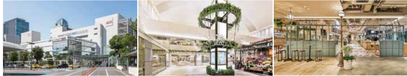
開業：1958年12月1日 アトレ化：2012年3月29日 エキナカ開業：2018年2月17日 SC階数：地下1階、地上8階 / 駅構内 SC延床面積：61,024㎡ 店舗面積：26,221㎡