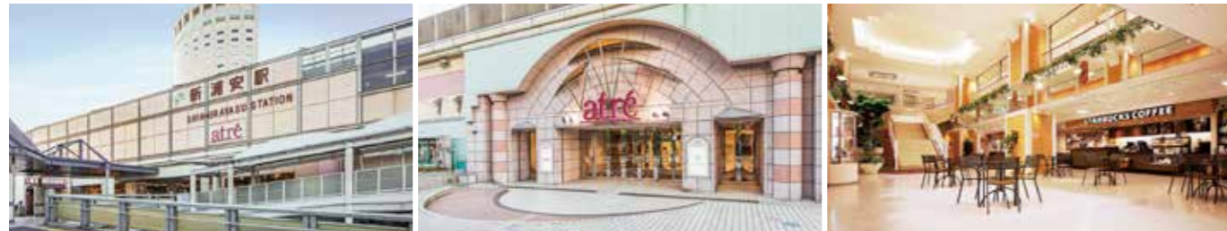
開業：1993年2月26日 SC階数：地上2階 SC延床面積：14,802㎡ 店舗面積：7,154㎡