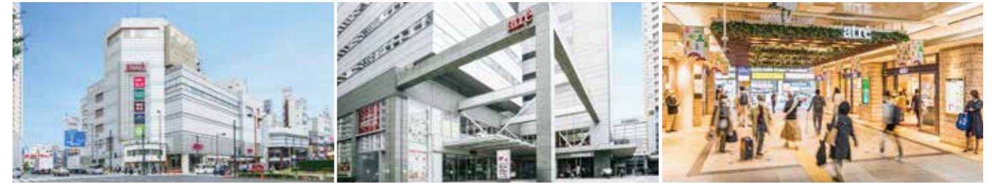
[アトレ目黒1 A館] 開業：1967年11月25日 アトレ化：2005年12月2日 SC階数：地下1階、地上5階 SC延床面積：10,778㎡ 店舗面積：4,927㎡ [アトレ目黒1 B館] 開業：1967年11月25日 アトレ化：2005年12月2日 SC階数：地下1階、地上3階 SC延床面積：4,867㎡ 店舗面積：2,823㎡ [アトレ目黒2] 開業：2002年4月2日 SC階数：地上2階 SC延床面積：2,116㎡ 店舗面積：1,947㎡