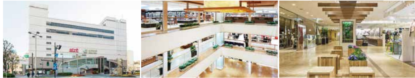
[アトレ大井町] 開業：1993年3月11日 SC階数：地上7階 SC延床面積：24,353㎡ 店舗面積：9,516㎡ [アトレ大井町2] 開業：2011年3月3日 SC階数：地上3階 SC延床面積：1,477㎡ 店舗面積：950㎡