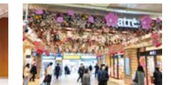
四季を感じる館内装飾