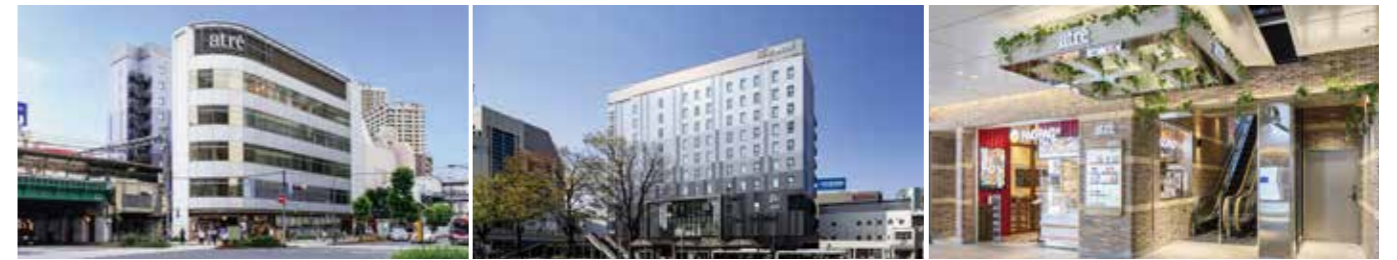
[アトレ五反田1] 開業：2008年3月14日 SC階数：地上5階 SC延床面積：1,138㎡ 店舗面積：791㎡ [アトレ五反田2] 開業：2020年3月26日 SC階数：地上3階 SC延床面積：1,107㎡ 店舗面積：740㎡