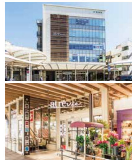
開業：2012年8月31日 SC階数：地上5階 SC延床面積：2,860㎡ 店舗面積：1,237㎡