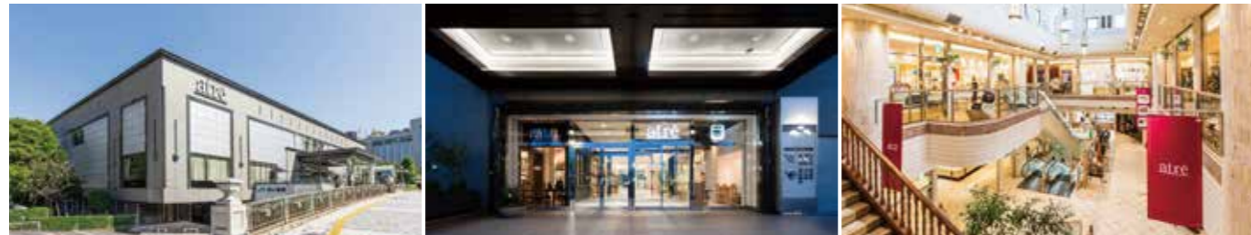
開業：1990年9月28日 SC階数：地上2階 SC延床面積：2,896㎡ 店舗面積：1,540㎡