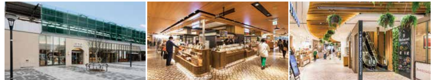
[South Area / North Area] 開業：2015年11月25日 SC階数：地上2階 SC延床面積：6,963㎡ 店舗面積：3,559㎡ [West Area] 開業：2018年3月16日 SC階数：地上4階 SC延床面積：4,266㎡ 店舗面積：1,936㎡