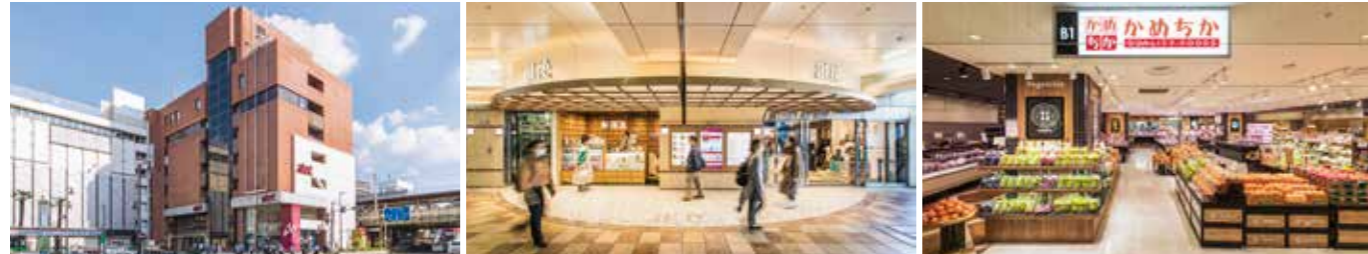
開業：1978年10月12日 アトレ化：2006年3月24日 SC階数：地下1階、地上7階 SC延床面積：33,141㎡ 店舗面積：12,695㎡ ※駐車場棟含む