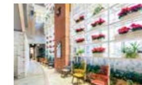
居心地のいい休憩スペース