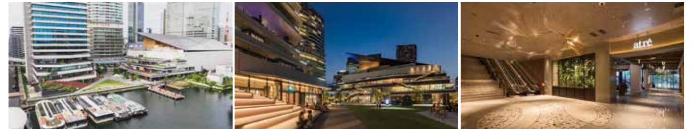
[アトレ竹芝タワー棟] 開業：2020年6月17日 SC階数：地上3階 SC延床面積：5,048㎡ 店舗面積：2,802㎡ [アトレ竹芝シアター棟] 開業：2020年8月7日 SC階数：地上3階 SC延床面積：6,898㎡ 店舗面積：5,069㎡