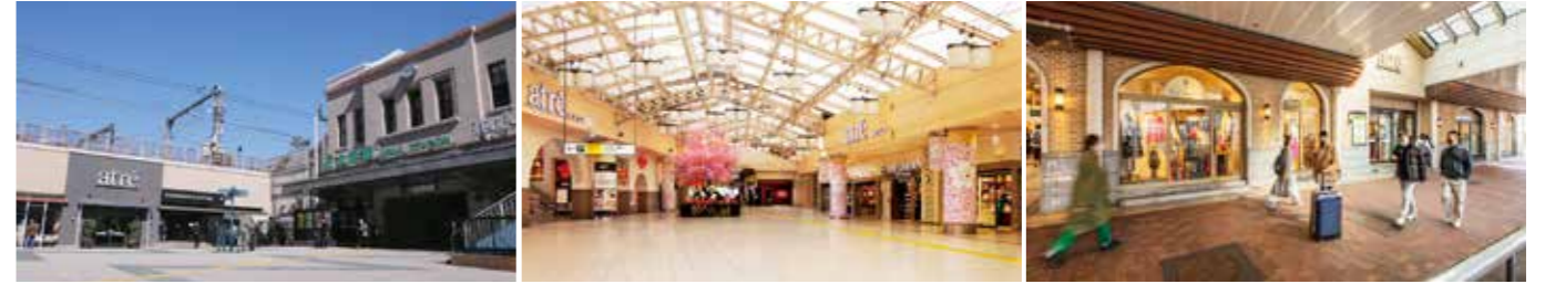
開業：2002年2月22日 SC階数：地上2階、地下1階 SC延床面積：8,748㎡ 店舗面積：6,581㎡