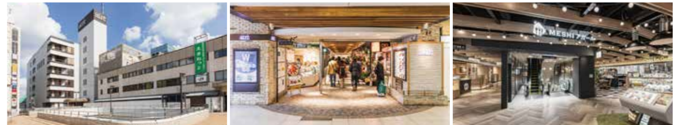
開業：1977年4月2日 アトレ化：2012年3月16日 SC階数：地上8階 SC延床面積：16,821㎡ 店舗面積：6,932㎡