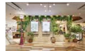
安らぎを感じるグリーンの演出

お買い物を楽しんでいただくだけでなく、誰もが心地よくつろげるような空間を作るために、共用部にグリーンを設置し、四季を彩る演出を行っています。また、清潔で使い心地のいいトイレや授乳室を整備し、快適で安心してご利用いただける空間づくりに努めています。