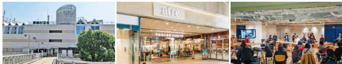
開業：1988年9月21日 アトレ化：2020年3月26日 SC階数：地上5階 SC延床面積：17,684㎡ 店舗面積：7,648㎡