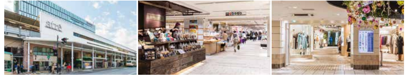
開業：1969年12月3日 アトレ化：2010年4月1日 SC階数：地下1階、地上2階 SC延床面積：34,321㎡ 店舗面積：12,899㎡