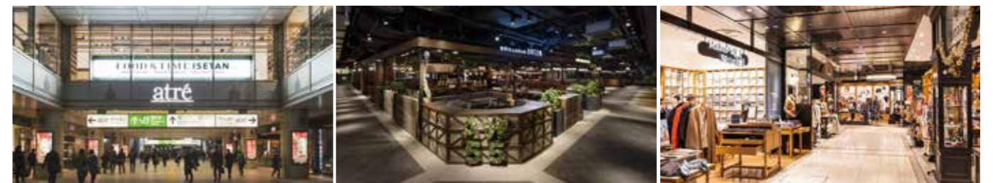
開業：2004年3月3日 SC階数：地上4階 SC延床面積：9,772㎡ 店舗面積：5,047㎡