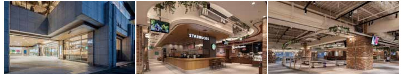
開業：1993年2月26日 SC階数：地上2階 SC延床面積：5,458㎡ 店舗面積：3,333㎡