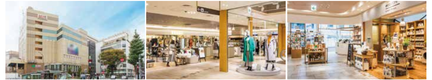
[アトレ恵比寿本館] 開業：1997年10月1日 SC階数：地上7階 SC延床面積：23,580㎡ 店舗面積：12,646㎡ [アトレ恵比寿西館] 開業：2016年4月15日 SC階数：地下1階、地上8階 SC延床面積：9,514㎡ 店舗面積：4,949㎡