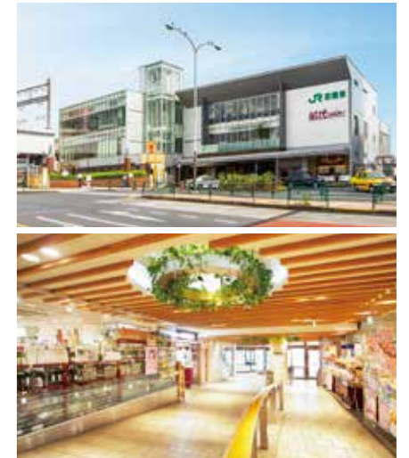
開業：2008年7月30日 SC階数：地上3階 SC延床面積：2,610㎡ 店舗面積：1,582㎡