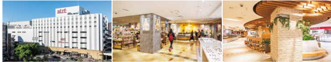
[アトレ大森1] 開業：1984年9月14日 アトレ化：2005年11月15日 SC階数：地下1階、地上8階 SC延床面積：41,504㎡ 店舗面積：18,476㎡ [アトレ大森2] 開業：2002年6月14日 アトレ化：2005年11月15日 SC階数：地上6階 SC延床面積：2,987㎡ 店舗面積：1,762㎡