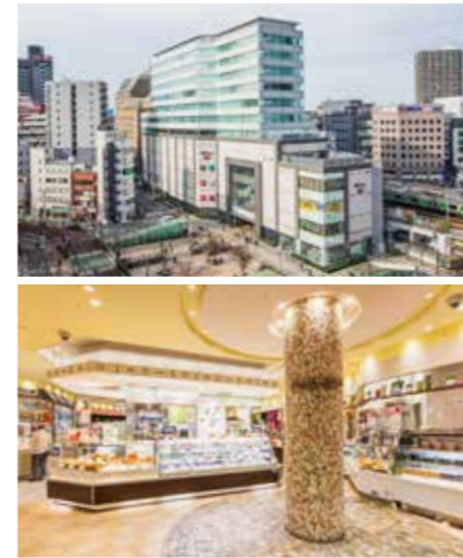
開業：2013年9月12日 SC階数：地下1階、地上4階 SC延床面積：5,927㎡ 店舗面積：3,781㎡